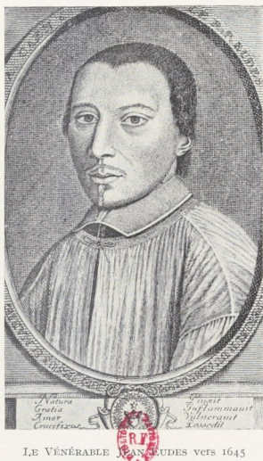
LE VÉNÉRABLE JEAN EUDES vers 1645

Portrait du P. Eudes trouvé à la Bibliothèque Nationale, section des estampes et dont on voit une reproduction à la bibliothèque de l'Arsenal. Publié en 1905, par Boulay en tête du premier volume de sa Vie du Vénérable Père Eudes , c'est bien, au dire des experts, la même figure que celle de la gravure Dievet (p. 80), mais à un âge différent.