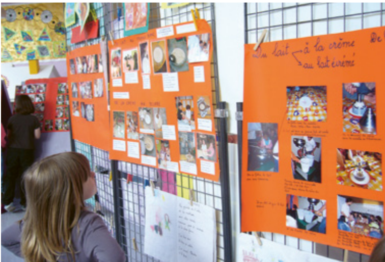
Une exposition à l'école Freinet d'Hérouville-Saint-Clair, réalisée par les enfants

De même, lorsque le déroulement des activités diffère selon le niveau, il est présenté en deux parties distinctes.