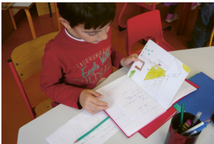
Un enfant relit son texte