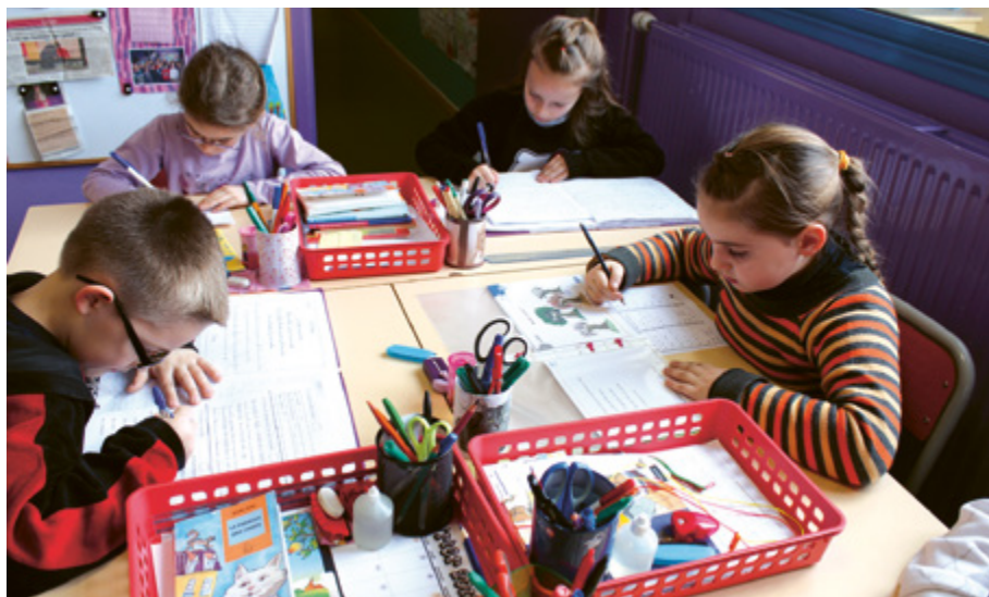
Des enfants en travail individualisé

Ainsi occupé de sa tête et de ses mains, non seulement il échappe au « mourir d'ennui » gravé sur chaque pierre poussiéreuse de l'édifice scolaire, mais il accroit aussi ce que Freinet appelle sa puissance de vie, c'est-à-dire « cette force créatrice, cette puissance qui pousse les êtres vivants à croître et à persévérer. C'est cette force qui préside à l'activité naturelle des enfants. 6 »